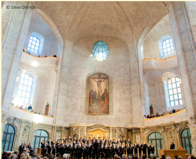
Tag der Kreuzkirche©

Dresdner Adventskalenderfest© Sonnabend, 2. Dezember | ab 14.30 Uhr Advent Calendar Festival Saturday, December 2nd | from 2.30 p.m.