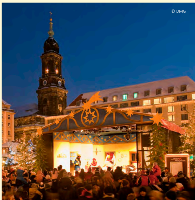
Fest der weihnachtlichen Klänge©

Dresdner Pyramidenfest© Sonnabend, 16. Dezember | ab 13.30 Uhr Pyramid Festival Saturday, December 16th | from 1.30 p.m.